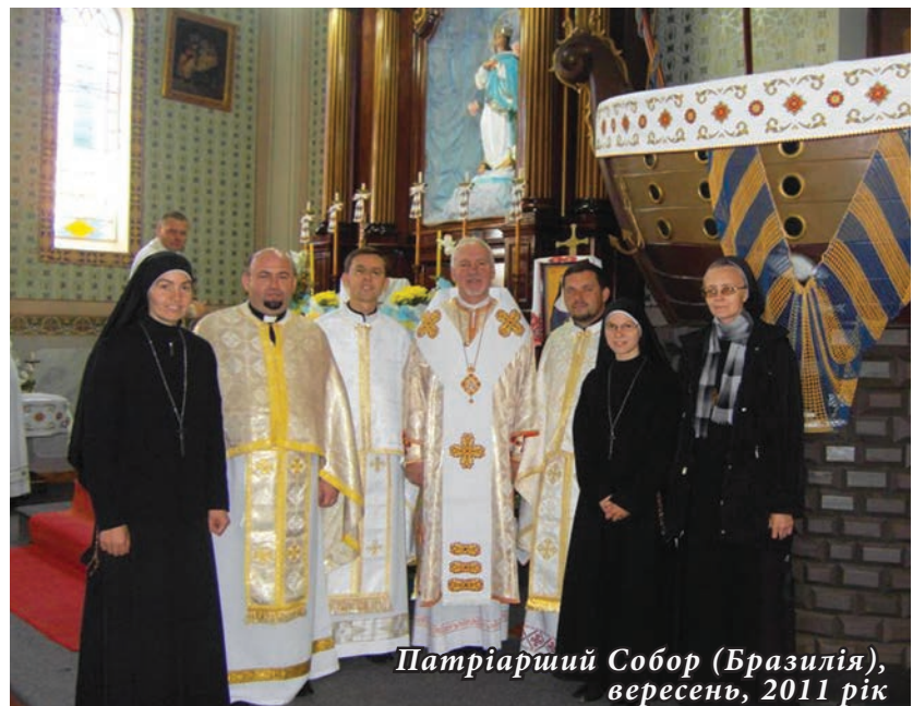
Патріарший Собор (Бразилія), вересень, 2011 рік