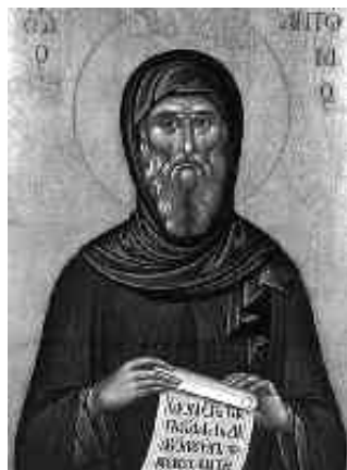
Розважливість, досвідченість – плоди благочестя та духовної зрілості

13. Люди зазвичай називаються розумними в неправильно-му значенні цього слова. Не ті розумні, які вивчили вислови і писання древніх мудреців, але ті, в яких душа розумна, які можуть розрізнити добро від зла; і всього злого та шкідливого для душі вони уникають, а про добре і корисне розумно радіють і роблять те з великою вдячністю Богові. Тільки вони одні повинні правдиво називатися розумними людьми.