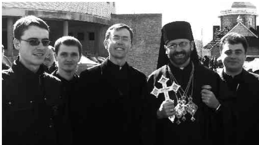
Назустріч новому Патріарху