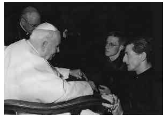
Блаженний Іван Павло II та отці Йосиф Попович, ВС (зліва), Григорій Рогацький, ВС (справа), 2004 рік.

Беатифікація – це визнання святим певної особи чи групи осіб, але з дозволом та заохотою для почитання на певному локальному рівні, а не на загальному. Натомість канонізація – це є остаточне потвердження святості (саме потвердження, бо святими робить Сам Господь, що Церква може лише потвердити), а також є рекомендацією до почитання. Для беатифікації, необхідною умовою є чудо, здійснене за посередництва Слуги Божого, відносно якого триває процес беатифікації (винятком є тільки щодо титулу мученика за віру, де потрібно тільки свідки, що він помер мученичою смертю за віру).