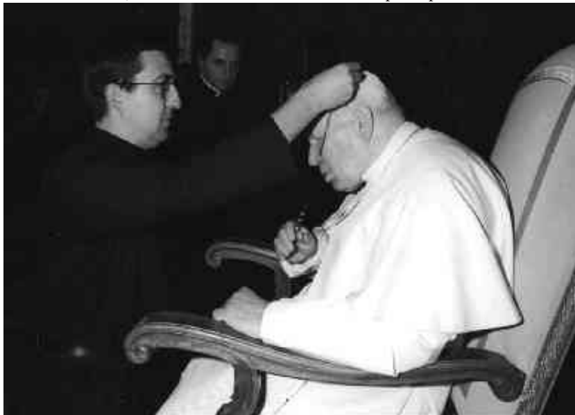
Отець Йосиф Монтес, ВС дарує Папі хрест Згромадження, 2000 рік.

В липні 1967 року у віці 47 років Кароль Войтила отримав Кардинальський титул. Він став наймо-