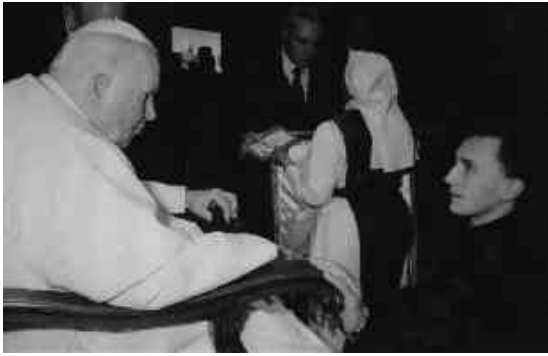
Блаженний Іван Павло II та отець Василь Харкавий, ВС, 2004 рік.

втричі перевищує відстань від Землі до Місяця. У ході цих відвідин Папа відвідав 1022 міста на всіх континентах і провів за межами Ватикану, в цілому, понад 822 доби (при тому, що перша закордонна поїздка Папи в історії Церкви взагалі відбулася тільки в середині XX століття, і здійснив її Павло VI.) Проте нездійсненою мрією Івана Павла II так і залишилася поїздка до Росії.