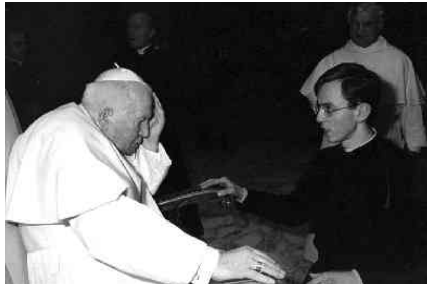
Блаженний Іван Павло II та отець Йосафат Бойко, ВС, 2001 рік.

16 жовтня 1978 року, в одній з кардинальських подорожей по світу, Кароль Войтила отримує повідо-